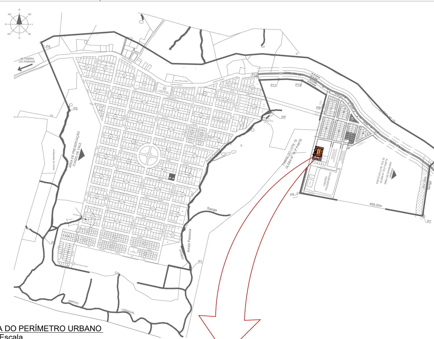
MAPA DO PERÍMETRO URBANO Sem Escala